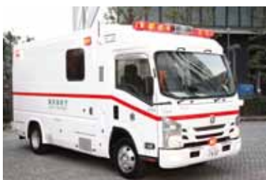
特殊救急車(陰圧型)

救急車で、患者室と運転席の間の隔壁に気密性ドアが設置されているため、運転席側の隊員の感染リ