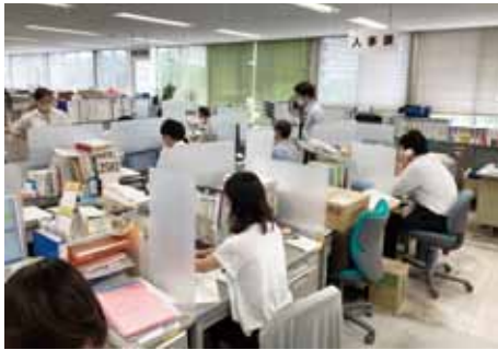
建物の制約から、デスク間隔を2m空けるのは現実的には不可能だが、隣と対面に仕切りを設置し、飛沫感染を防ぐ