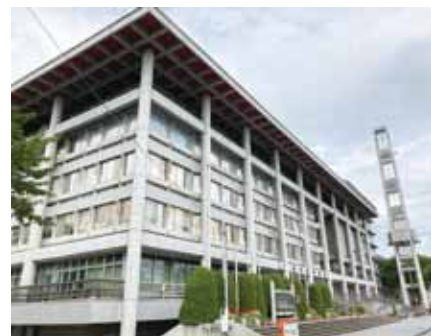
大津市役所本庁舎は、本館、新館、別館に分かれており、それぞれが連絡通路で結ばれている。本館は東西のエリアに分かれており、今回は3・4階の西エリアで感染者が発生した。写真は本館・正面と東側エリア。