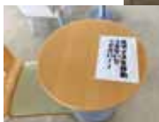
食事中は、飛沫感染のリスクが高くなる。職員の食事スペースは席の間隔を空け、感染リスク低減を図る。写真上はクラスター発生前、下が発生後。テーブルを勝手に移動させない注意書きも