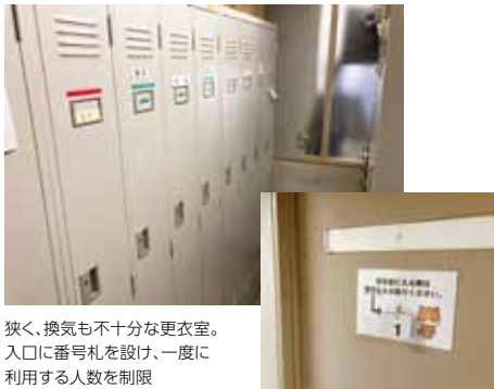
狭く、換気も不十分な更衣室。入口に番号札を掛け、一度に利用する人数を制限