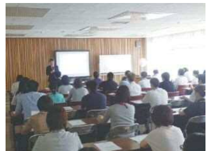
メンタルヘルス対策研修

平成29年9月には、地方公務員安全衛生推進協会の事業である「メンタルヘルス対策支援専門員派遣事業」を活用し、メンタルヘルス対策研修を開催。講師からの自分のストレスの気づき、仲間の不調への気づき等につ